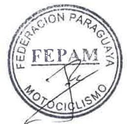
Federación Paraguaya Motociclismo FRESIDENTE FEPAM