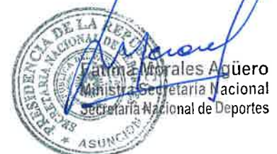
Fátima Morales Agüero Ministra Secretaria Nacional Secretaría Nacional de Deportes

A través de los festivales de actividades físicas, recreativas y deportivas, se busca promocionar e incentivar la práctica del deporte como un medio para el desarrollo integral del escolar, teniendo en cuenta que a través del ejercicio físico, se potencian cualidades orgánicas y neuromusculares y capacidades psíquico-sociales como la autoestima, el relacionamiento grupal, resolución de conflictos, entre otros.