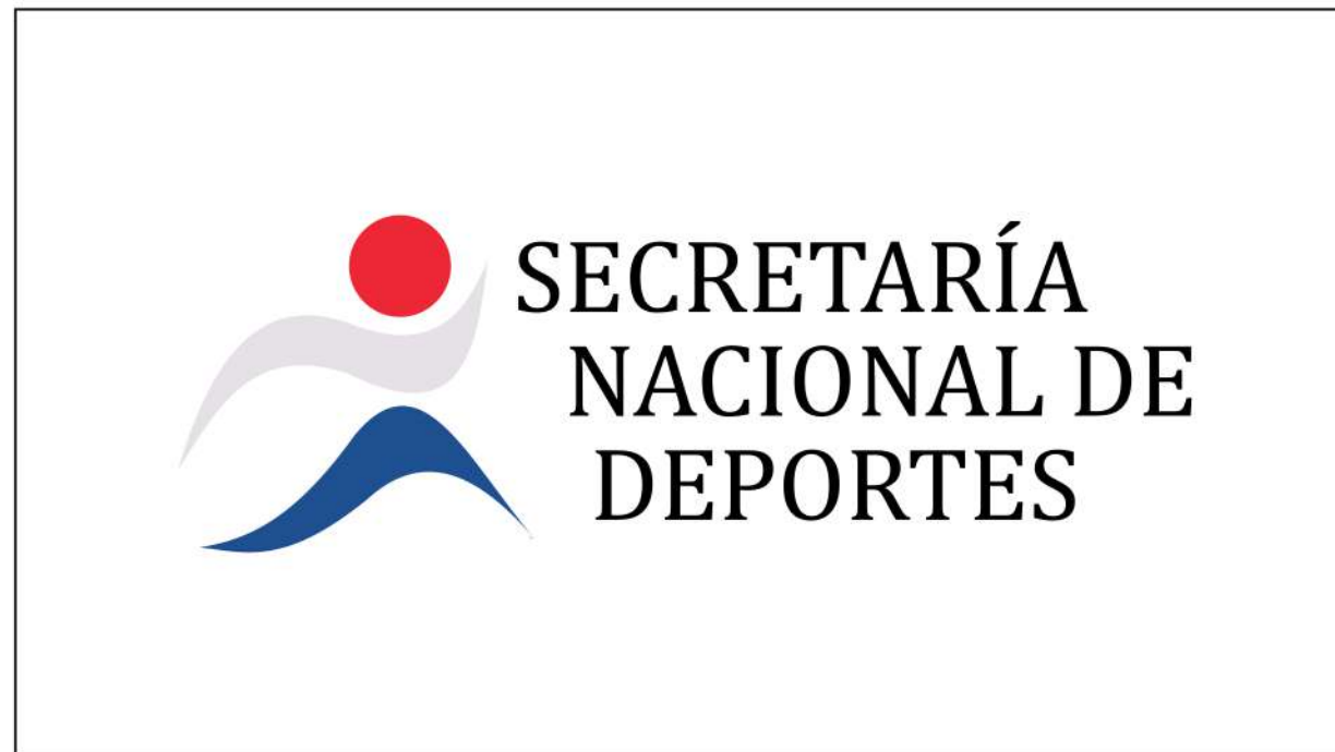
CAMBIO DE TIPOGRAFIA