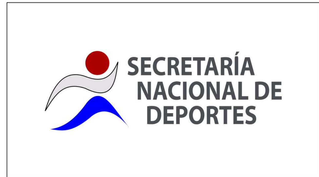
CAMBIO DE COLORES