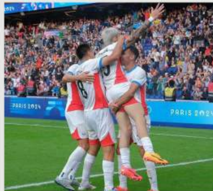
La Albirroja Sub 23, el equipo de Fútbol de Paraguay, demostró la garra guaraní consiguiendo un diploma olímpico para nuestro país y quedando entre las mejores 8 selecciones de los Juegos Olímpicos.